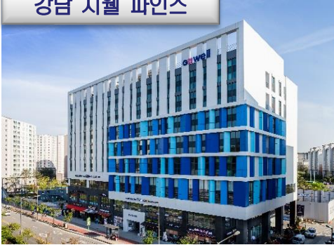
강남 지웰 파인즈