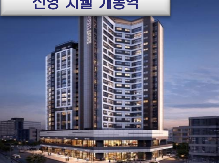
신영 지웰 개봉역