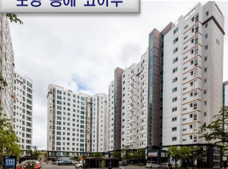
포항 동해 쿼아루