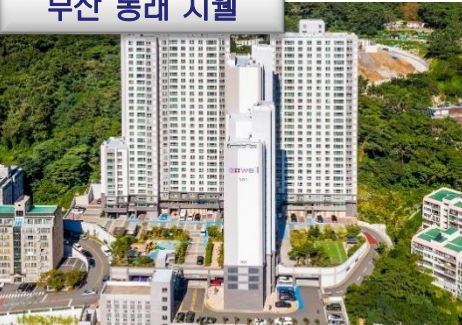
부산 동래 지웰