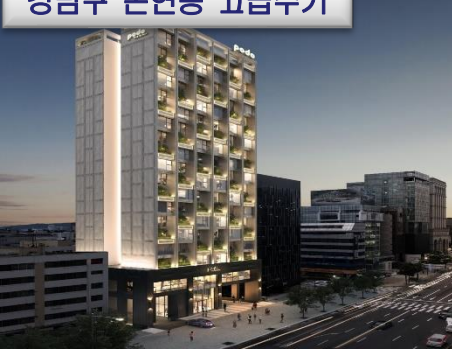
강남구 논현동 고급주거