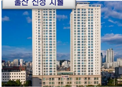
울산 신정 지웰