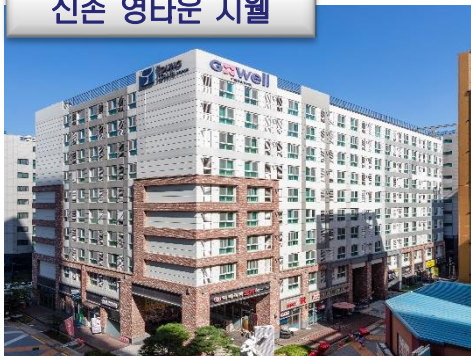
신촌 영타운 지웰