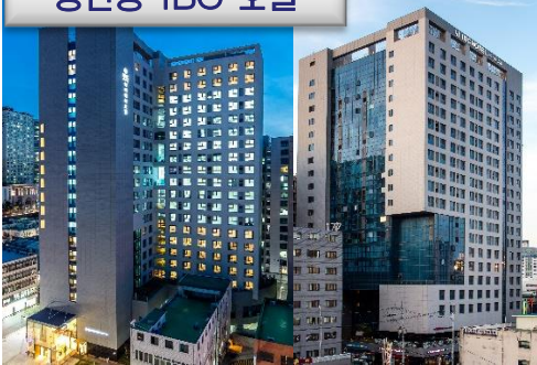
송인동 IBC 호텔