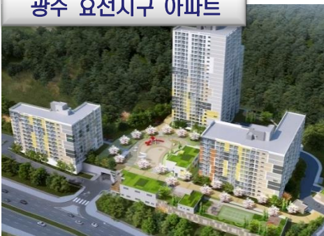
광주 효천지구 아파트