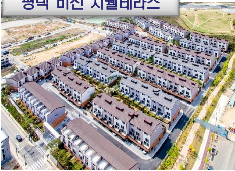
평택 비전 지웰테라스