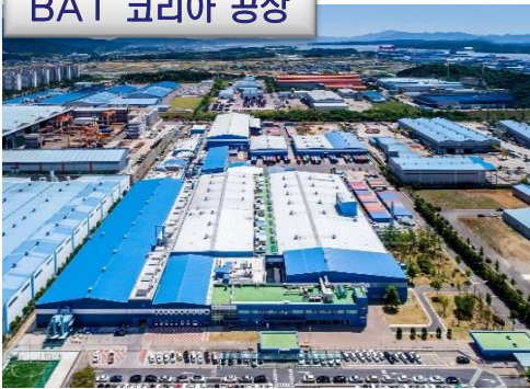
BAT 코리아 공장