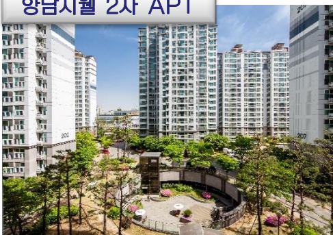
향남지웰 2차 APT