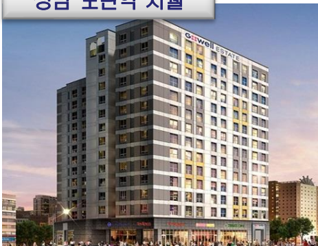
성남 모란역 지웰