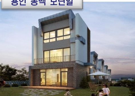
용인 동백 모던힐