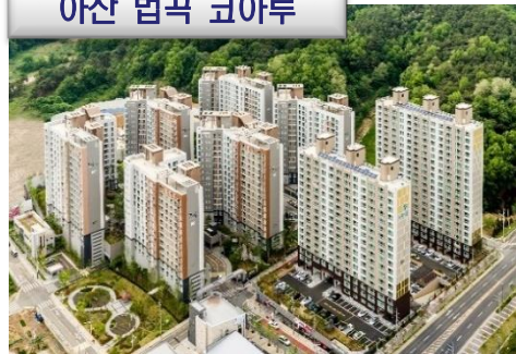
아산 법곡 코아루