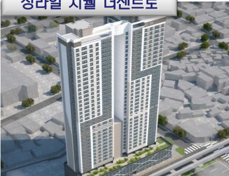
청라힐 지웰 더센터로