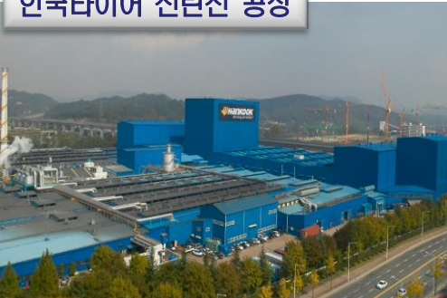
한국타이어 신탄진 공장