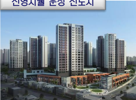
신영지웰 운정 신도시