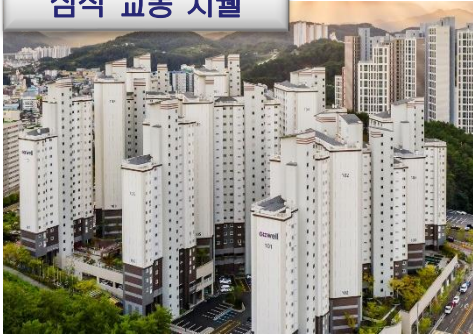
삼척 교통 지웰