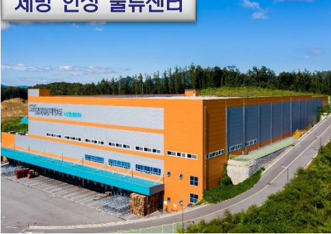
세방 안성 물류센터